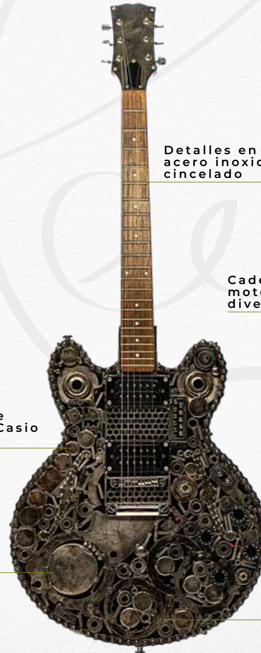
Bujes de discos de amoladora de banco