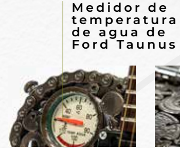
Medidor de temperatura de agua de Ford Taunus