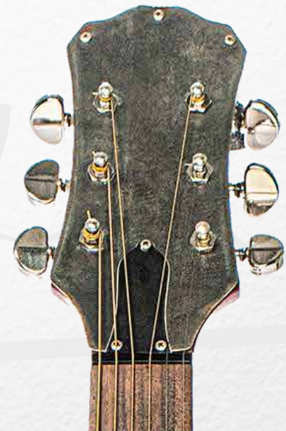
Chapas de autos Ford -Falcon y Taunus-