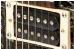
Chapas de camioneta Chevrolet c10