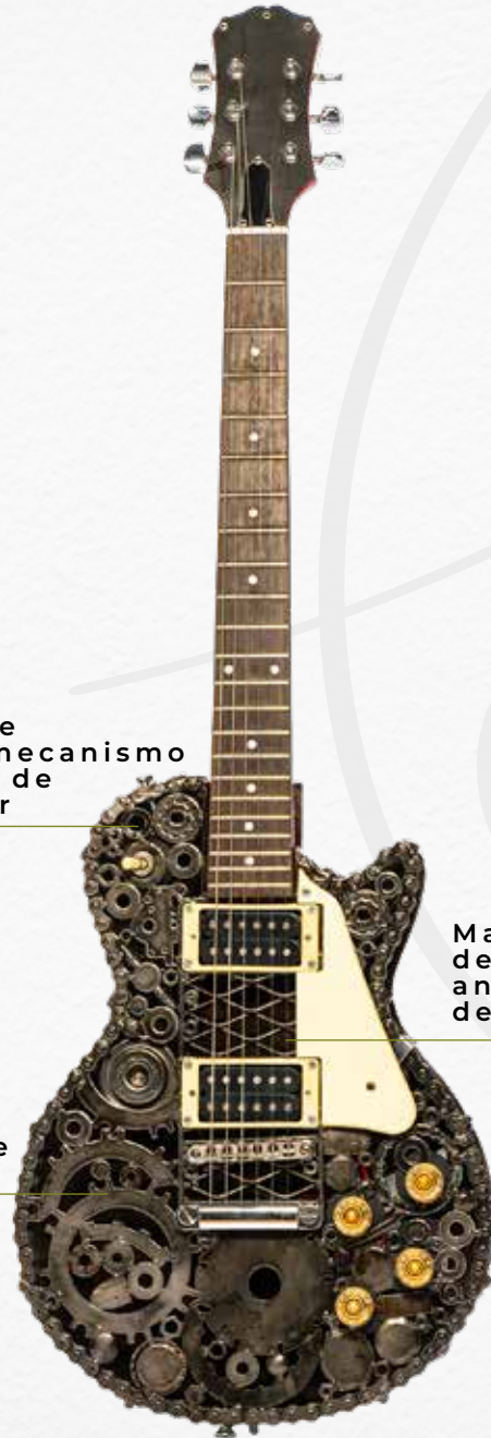
Malla de metal desplegado de una antigua máquina de coser Singer