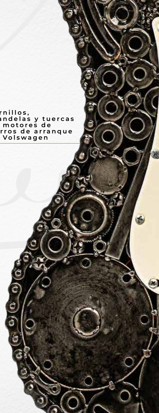
Tornillos, arandelas y tuercas de motores de burros de arranque de Volkswagen