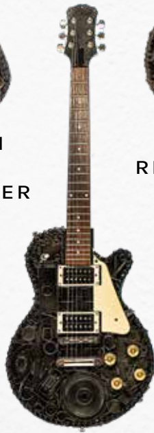
LES PAUL REVIVAL