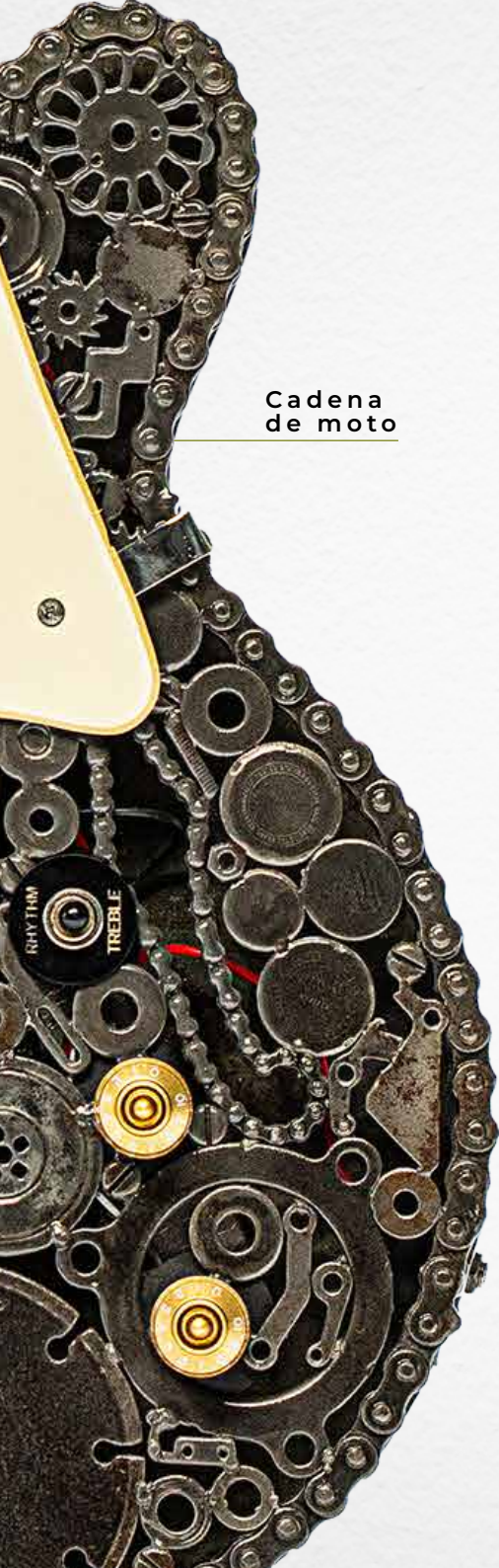
Cadena de moto