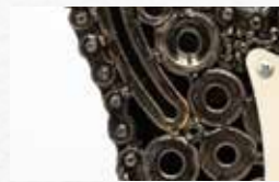
Partes de máquina de escribir y relojes