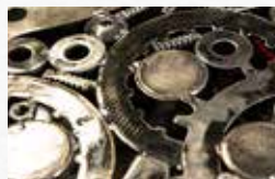
Burro de arranque de auto