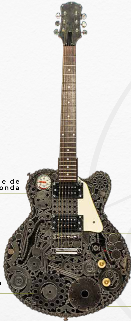
Embrague de motos Honda