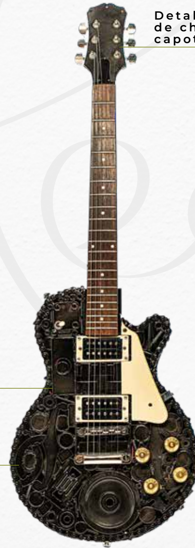
Detalles de Pala de chapa de capot de auto