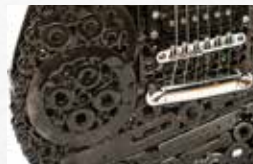
Piezas de máquina de escribir Olivetti