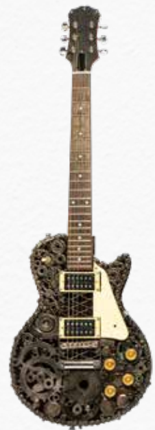
LES PAUL REIMAGINED