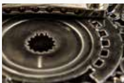
Tornillos, tuercas y embragues del motor de una moto Kawasaki