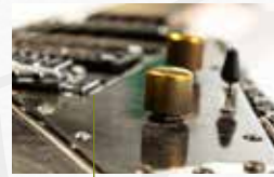
Potenciómetros en bronce pulido detalles de una esquina en aluminio pulido