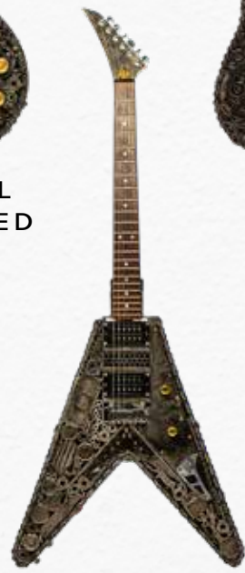
FLYING V SHARKTAIL