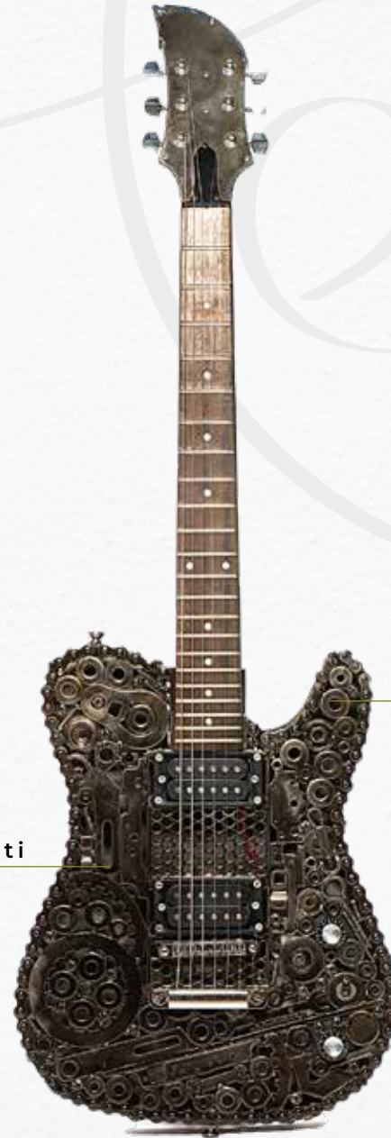
Tuercas y arandelas de motor de Ford Taunus y Renault 504