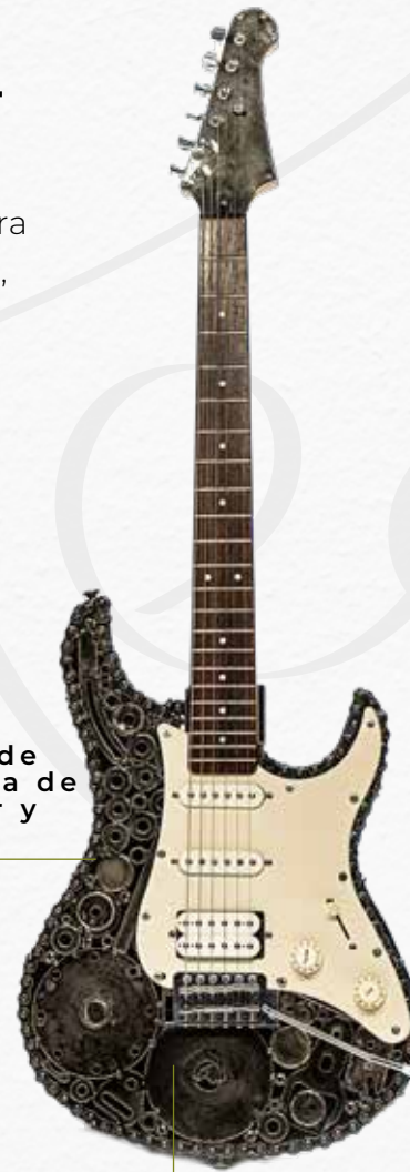
Discos de amoladora