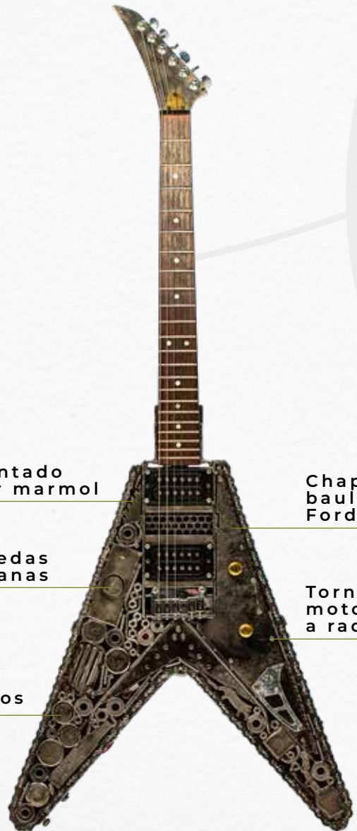
Chapas de baul de Ford Falcon