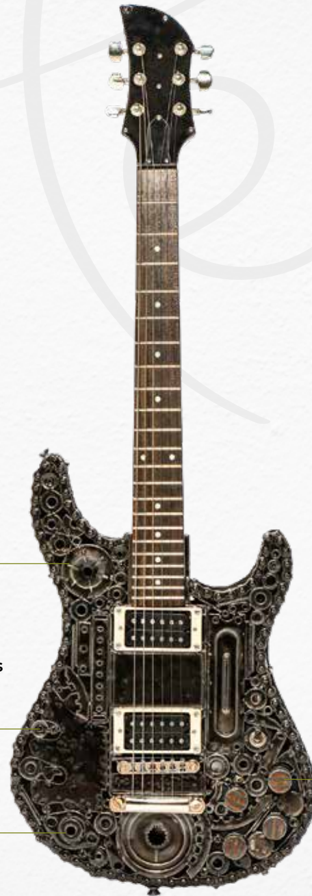
Potenciómetros de nogal y con detalle de aluminio pulido