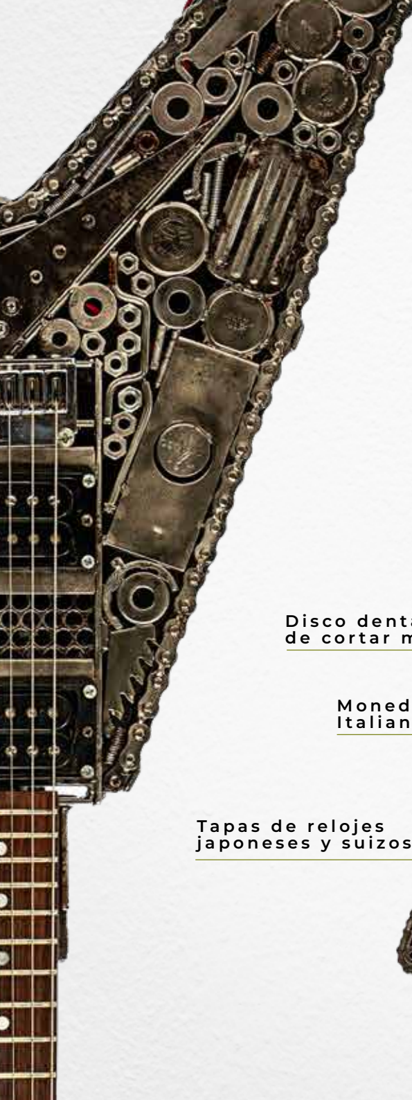
Disco dentado de cortar marmol