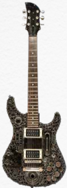
ST-TYPE 01 VINTAGE STRATOCASTER