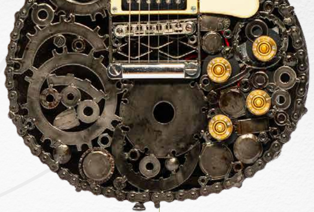
Disco de metal de amoladora