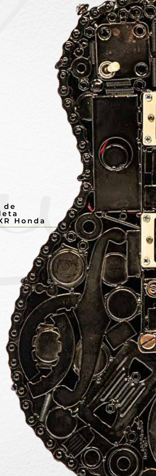
Cadenas de motocicleta Enduro XR Honda