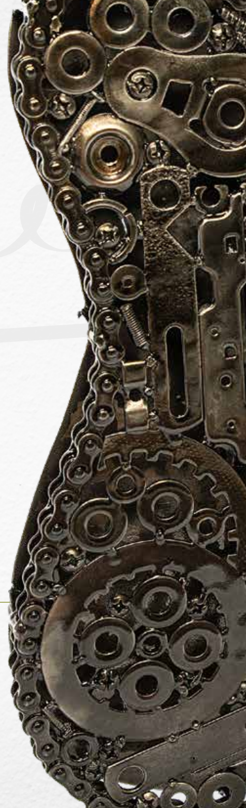
Discos de embragues de motocicletas