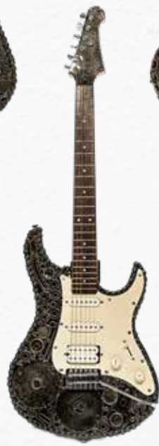
ST-TYPE 02 VERSATILITY AT ITS BEST