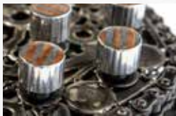
Partes de relojes